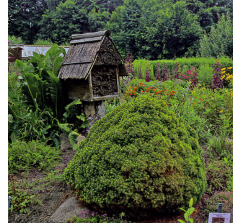
Im Biogarten Prieros zeigt sich die bunte Pflanzenvielfalt.

Der Biogarten hält Tipps und Tricks für ökologisches Gärtnern, Naturerleben für alle Sinne und kleine Naschereien am Wegesrand bereit. Dieses „grüne Klassenzimmer“ ist ein idealer Ort für Gruppenausflüge und Projekttag.