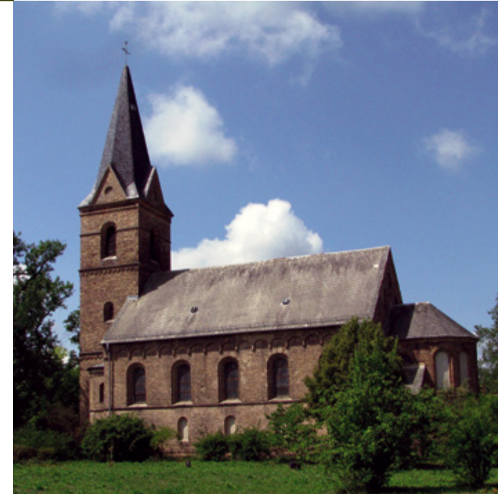
Die Kirche kann zu den Öffnungszeiten des Heimathauses besichtigt werden.

Wer den Rundweg zurück ins Dorf wählt, verlässt die Dahmebrücke Richtung Norden und schlägt sich westlich durch die Wiesen zum Dahmeufer. Dabei folgen die Füße immer den mit einem blauen Punkt gekennzeichneten Trampelpfad. Obwohl sich die ursprüngliche Dahme bereits am Überfallwehr in Märkisch Buchholz mit dem Spree-Umflutkanal vereint, sind ihre Ufer bis hier nach Prieros ruhig und erholsam. Über den schmalen Weg „Lucke“ findet der Ortsrundgang um Prieros seinen Abschluss.