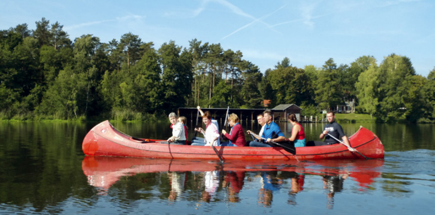
Mit Muskelkraft und dem Ranger auf der Dahme unterwegs